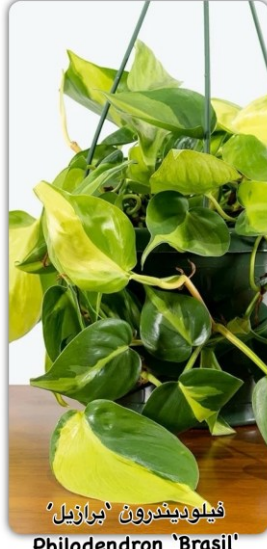
فيلوديندرون 'برازيل' Philodendron 'Brasil'