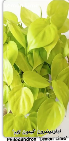
فيلوديندرون 'ليمون لايم' Philodendron 'Lemon Lime'