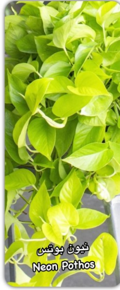
نيون بوتس Neon Pothos