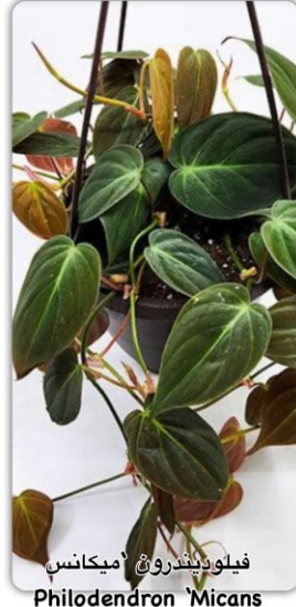
فيلوديندرون 'ميكانس' Philodendron 'Micans'