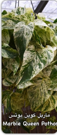
ماربل كوين بوتس Marble Queen Pothos