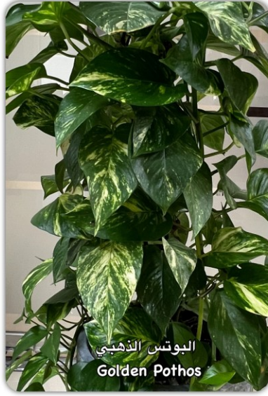
البوتس الذهبي Golden Pothos

البوتس نبات متسلق معروف بكونه ذو أوراق على شكل قلب، لامعة. يم تُستخدم غالبًا في السلال المعلقة أو كنبات متسلق. هذه النبات قوي وسهل العناية، يتحمل الإضاءة المنخفضة والري غير المنتظم، مما يجعله خيارًا شائعًا في البيئات الداخلية. كما أن قدرته على تنقية الهواء تضيف إلى جاذبيته كنبات منزلي.